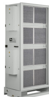
Centrale AC 8000 (Figure de droite)

LTA Luftechnik GmbH, Junkerstraße 2, 77787 Nordrach, Germany